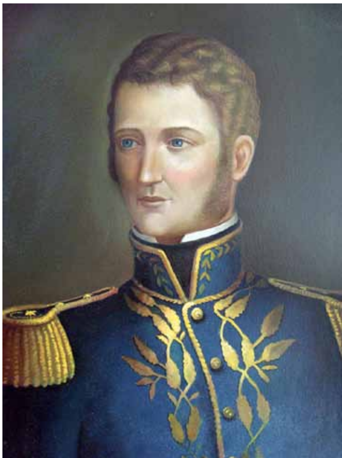
Don Juan José Carrera

y Juan Mackenna; especialmente este último, que ya había sido retado a duelo en Chile, en dos oportunidades por Juan José y por Luís Carrera, lances que nunca pudieron concretarse por oportunas “filtraciones” a las autoridades.